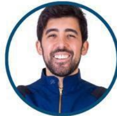
DR. HUGO PALMA

"Los protocolos de la Biomimética y su impacto en los resultados clínicos restauradores: ¿mitos o realidades?"